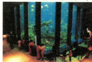
附属博物館として開設 「海洋科学博物館」