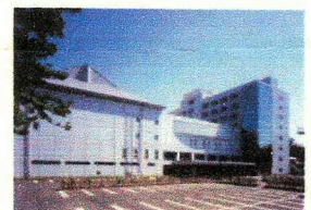
東海大学付属翔洋高校