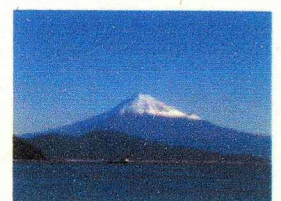
世界文化遺産の富士山