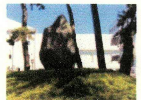
石碑「東海大学建学の地」