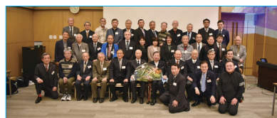
機友会・代々木会合同総会、講演会開催

また学長は「常に先駆者であれ」とのお言葉と数々の改革の実績を残され「時間が証明するでしょう」と結ばれた。ご講演のあとの懇親会・2次会までご出席頂き、参加者からは「とてもフレンドリーな楽しいひとときでした」といわれ、リアルな交流の機会を一緒に過ごせた時間でした。